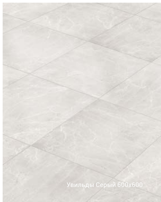
Увильды Серый 600x600