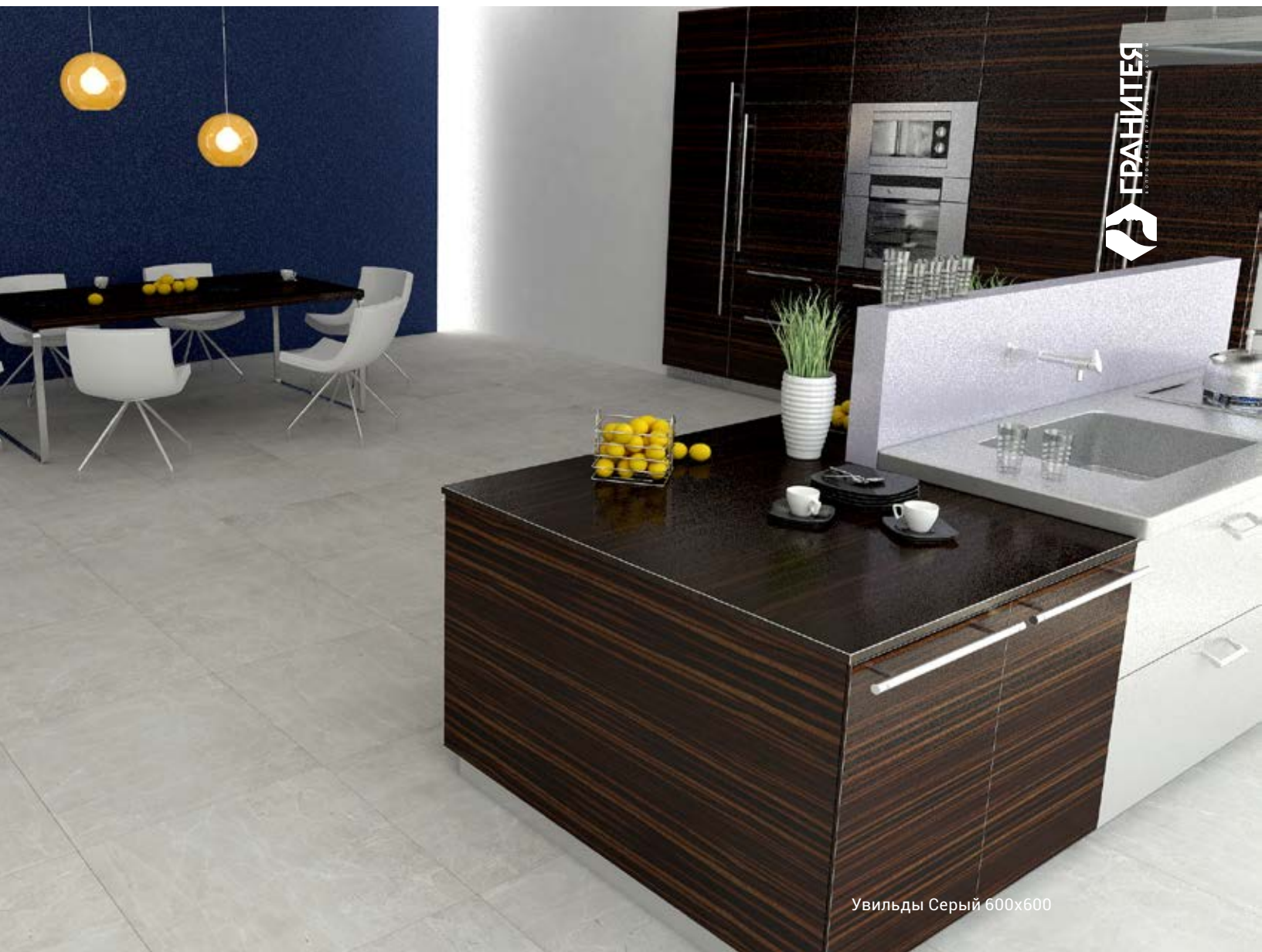
Увильды Серый 600x600