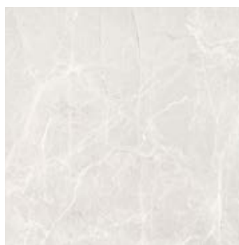
Увильды Серый G363-Uvildy Grey