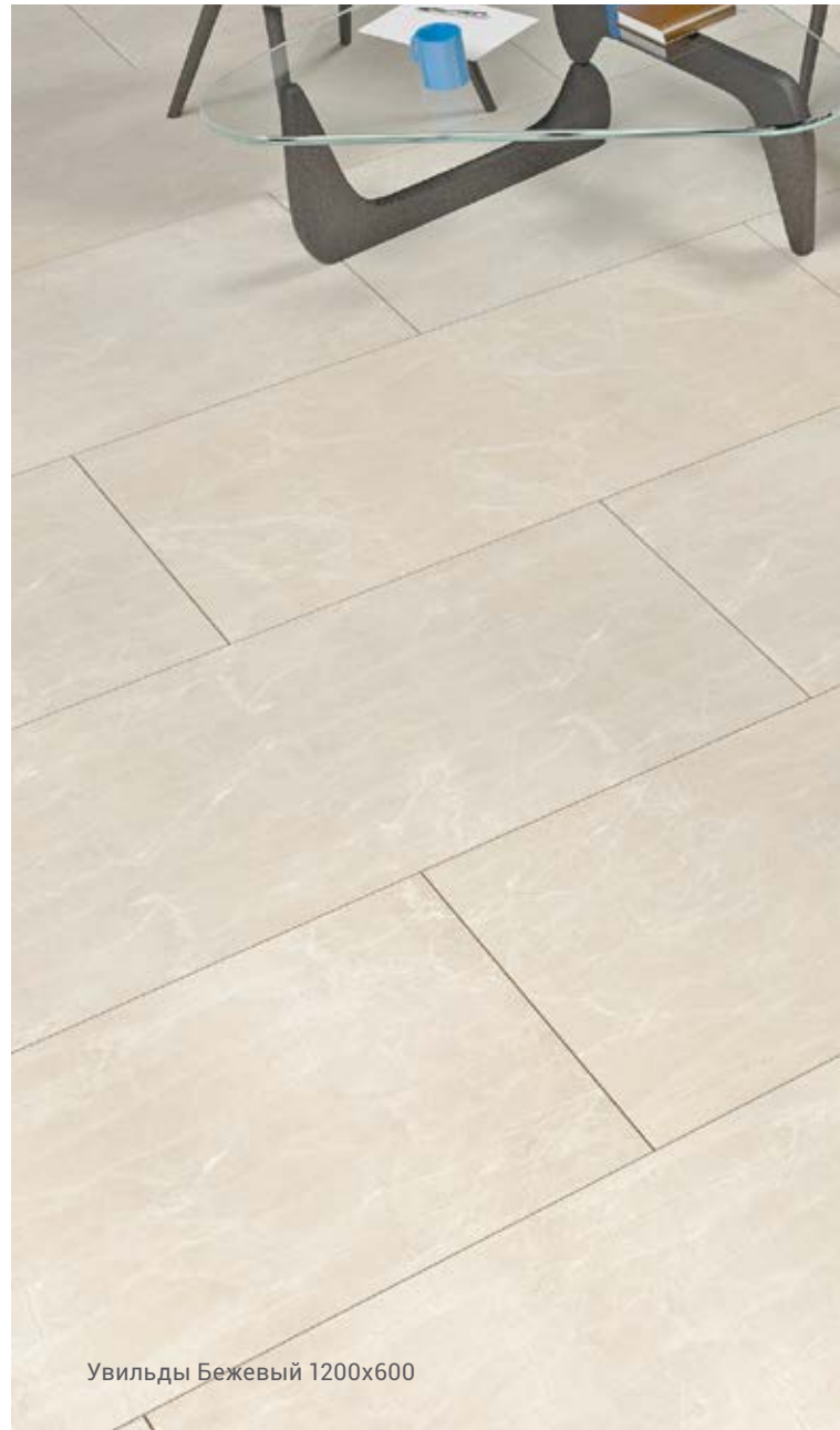
Увильды Бежевый 1200x600

Матовая поверхность / Matt / MR Полированная поверхность / Polished / PR