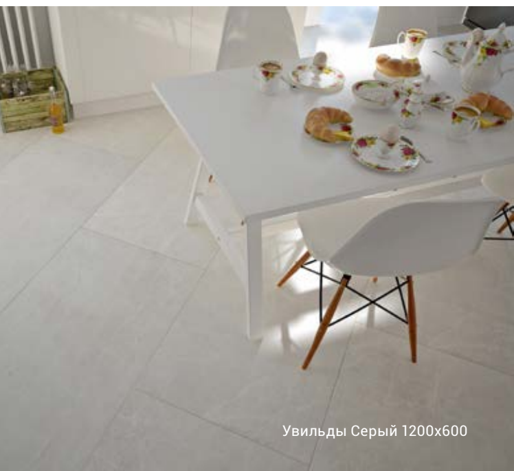
Увильды Серый 1200x600