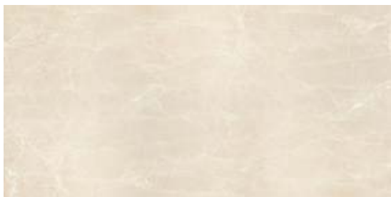
Увильды Бежевый G362-Uvildy Beige