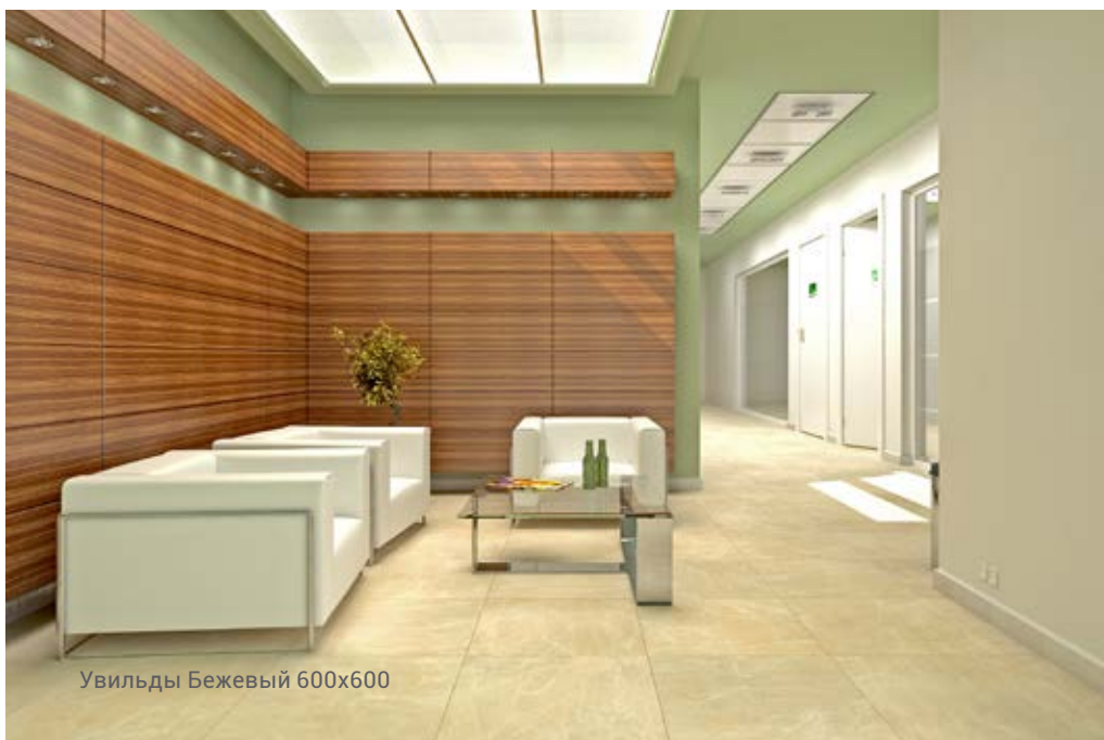
Увильды Бежевый 600x600