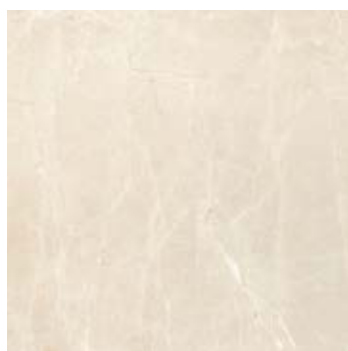
Увильды Бежевый G362-Uvildy Beige