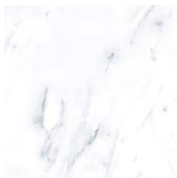
Пайер Серый 13 G283-Payer Grey