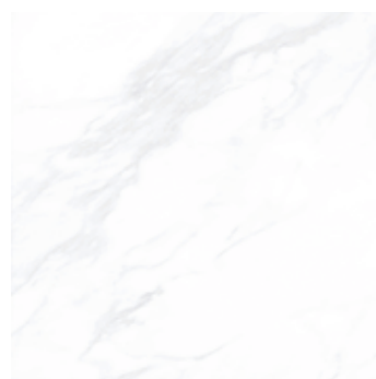
Пайер Элегантный 12 G281-Payer Elegant