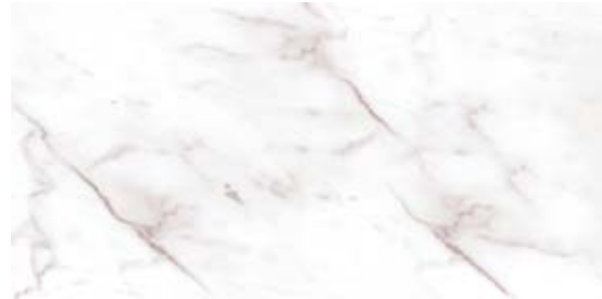
Пайер Бежевый G282-Payer Beige