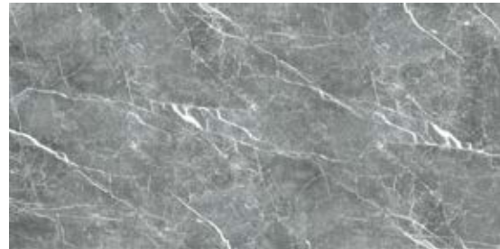
Пайер Черный G285-Payer Black