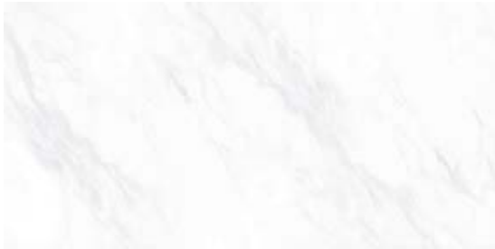
Пайер Элегантный G281-Payer Elegant