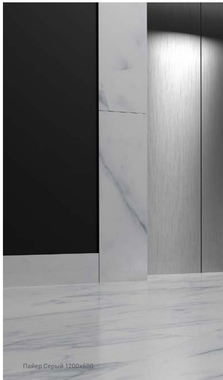
Пайер Серый 1200x600