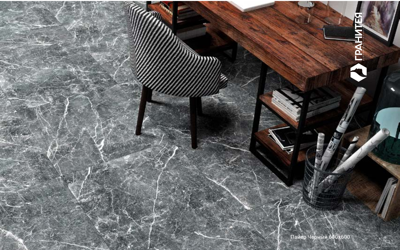
Пайер Черный 600x600