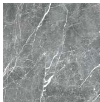
Пайер Черный 6 G285-Payer Black