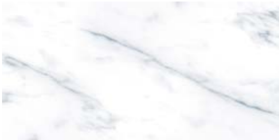
Пайер Серый G283-Payer Grey