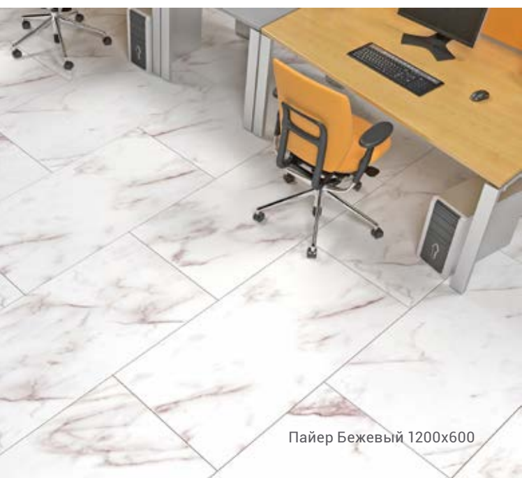
Пайер Бежевый 1200x600