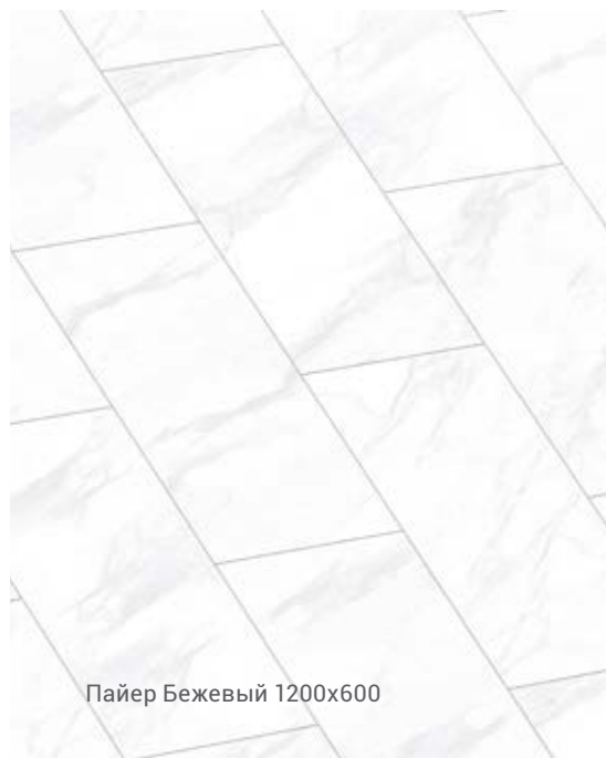
Пайер Бежевый 1200x600