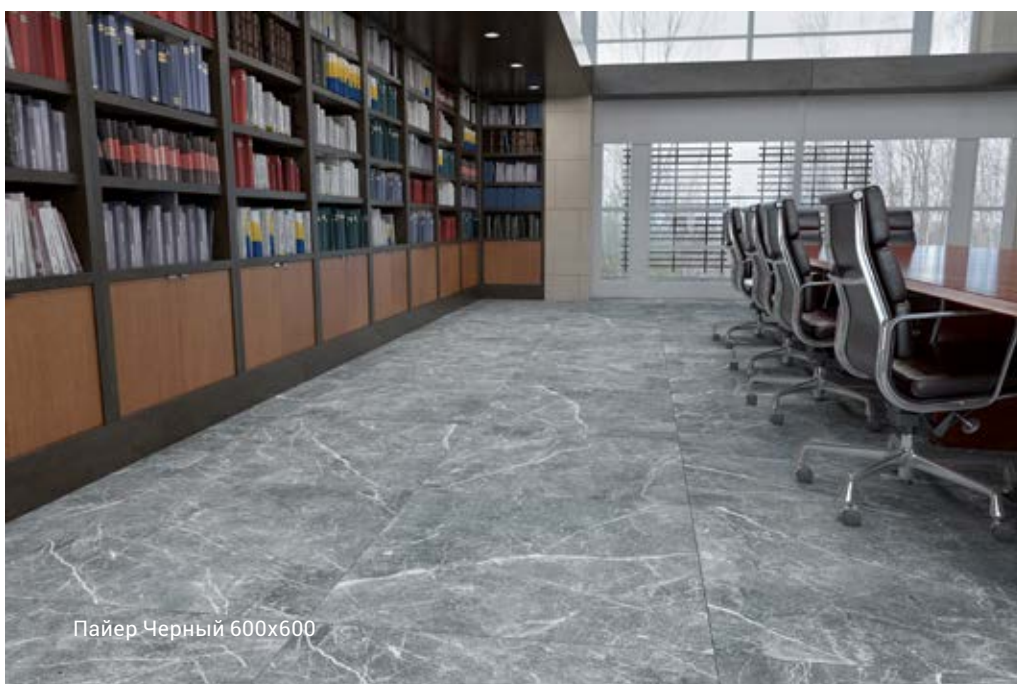
Пайер Черный 600x600