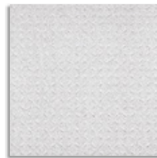
Abeto R-22 G.120