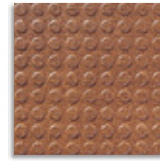
Arce R-14 G.120