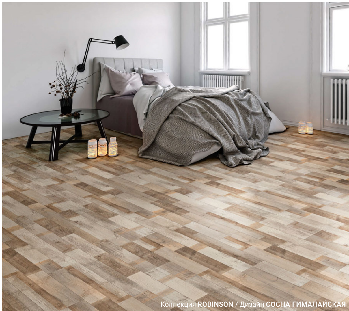
Коллекция ROBINSON / Дизайн СОСНА ГИМАЛАЙСКАЯ