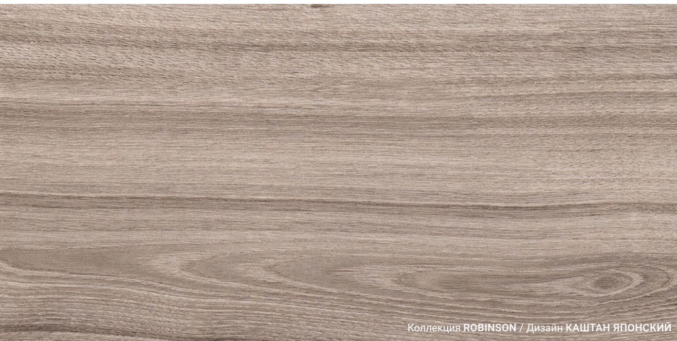
Коллекция ROBINSON / Дизайн КАШТАН ЯПОНСКИЙ