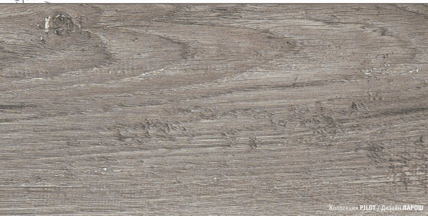
Коллекция PILOT / Дизайн ЛАРОШ