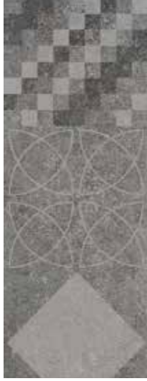
Renk: Antrasit Kenar: Rektifiyeli Color: Anthracite Edge: Rectified