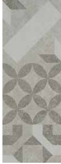
Renk: Gri Kenar: Rektifiyeli Color: Grey Edge: Rectified