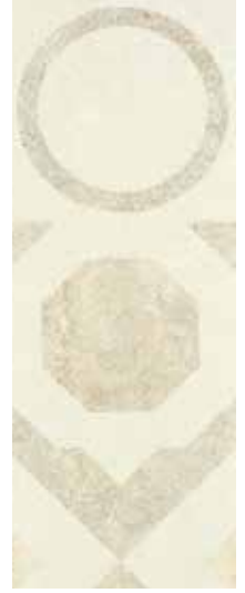
Renk: Beyaz Kenar: Rektifiyeli Color: White Edge: Rectified