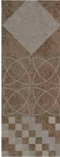
Renk: Kahve Kenar: Rektifiyeli Color: Brown Edge: Rectified