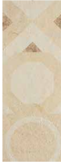
Renk: Bej Kenar: Rektifiyeli Color: Beige Edge: Rectified

Dekorlar her kutuda karışık olarak yer almaktadır. | Color key paintings are provided as mixed in each box. Eine Mischung aus Farbschlüssellackierungen in jeder Packung. | Ogni confezione contiene un mix dei colori principali. En cada caja se presentan pinturas de colores clave como mezclas. | В каждой коробке вы найдете смесь плиток разных оттенков.