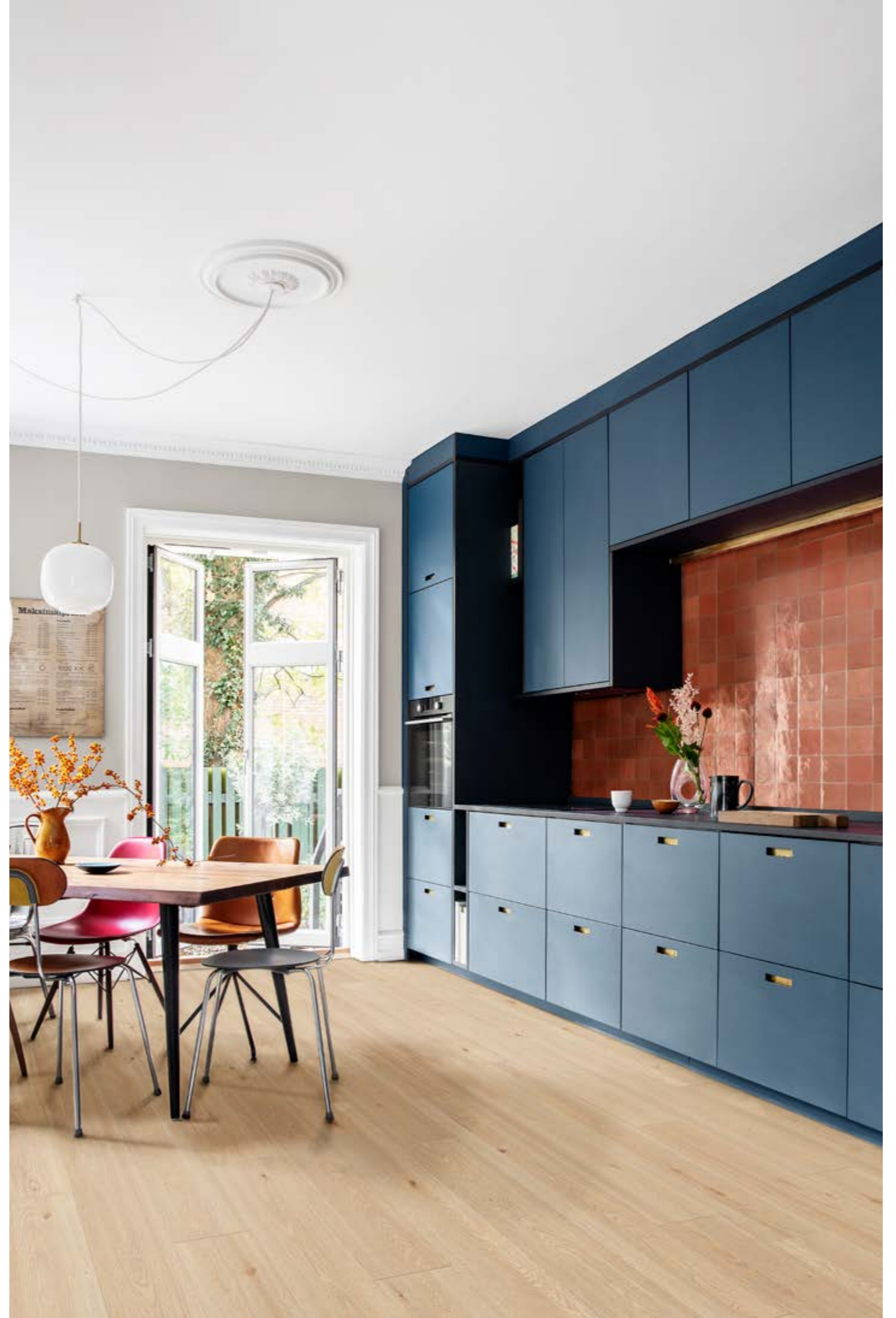
RC6M Secret Beige Rettificato 20x120 - 7 7 / 8 " x 47 1 / 4 " - R8G2 Mélange Bordeaux Glossy 10x10 - 3 15 / 16 " x 3 15 / 16 "