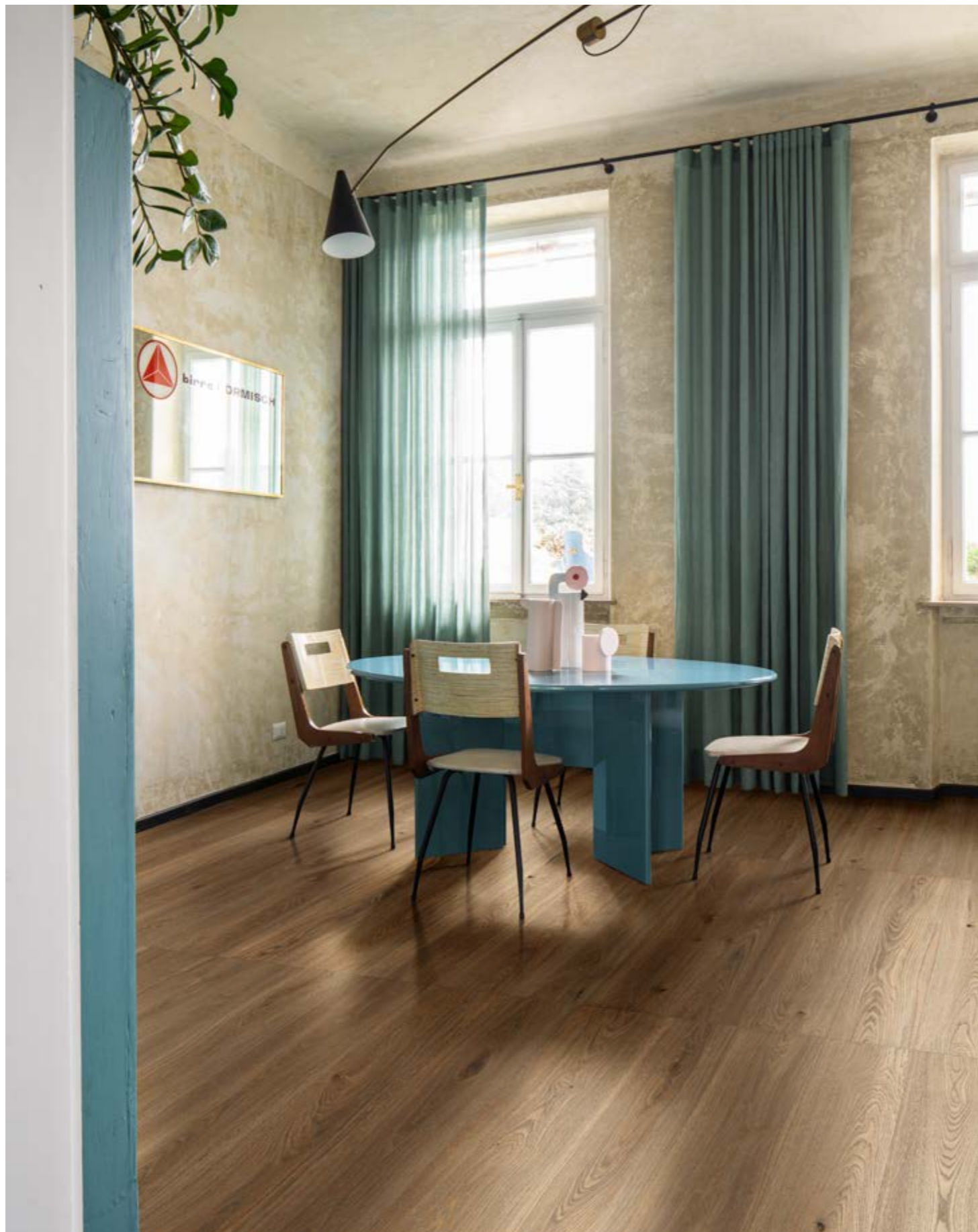
RC6R Secret Marrone Rettificato 20x120 - 7 7 / 8 " x 47 1 / 4 "