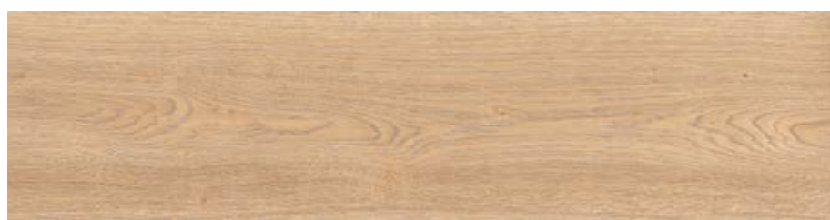
RC6N 20x120 Miele Rett RC6U 20x120 Miele Grip Rett