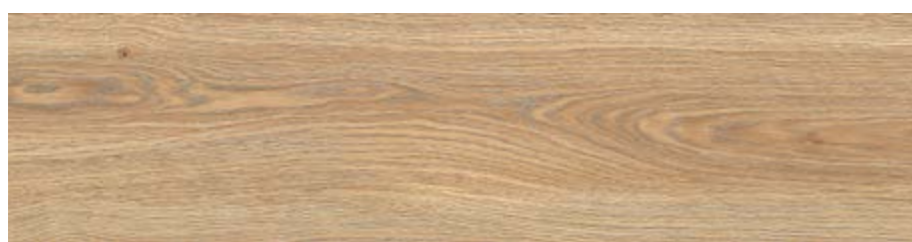
RC6P 20x120 Naturale Rett RC6V 20x120 Naturale Grip Rett