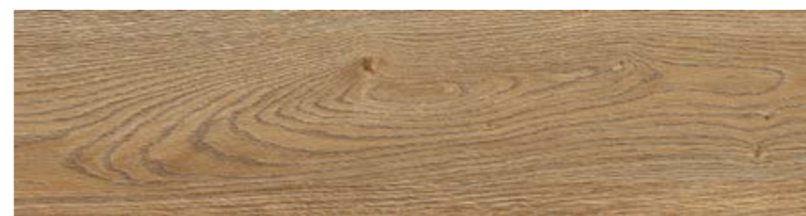
RC6Q 20x120 Rovere Rett RC6W 20x120 Rovere Grip Rett