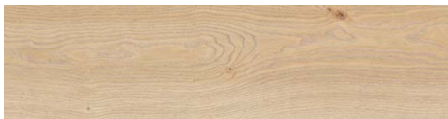
RC6M 20x120 Beige Rett RC6T 20x120 Beige Grip Rett