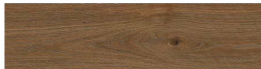
RC6R 20x120 Marrone Rett RC6X 20x120 Marrone Grip Rett