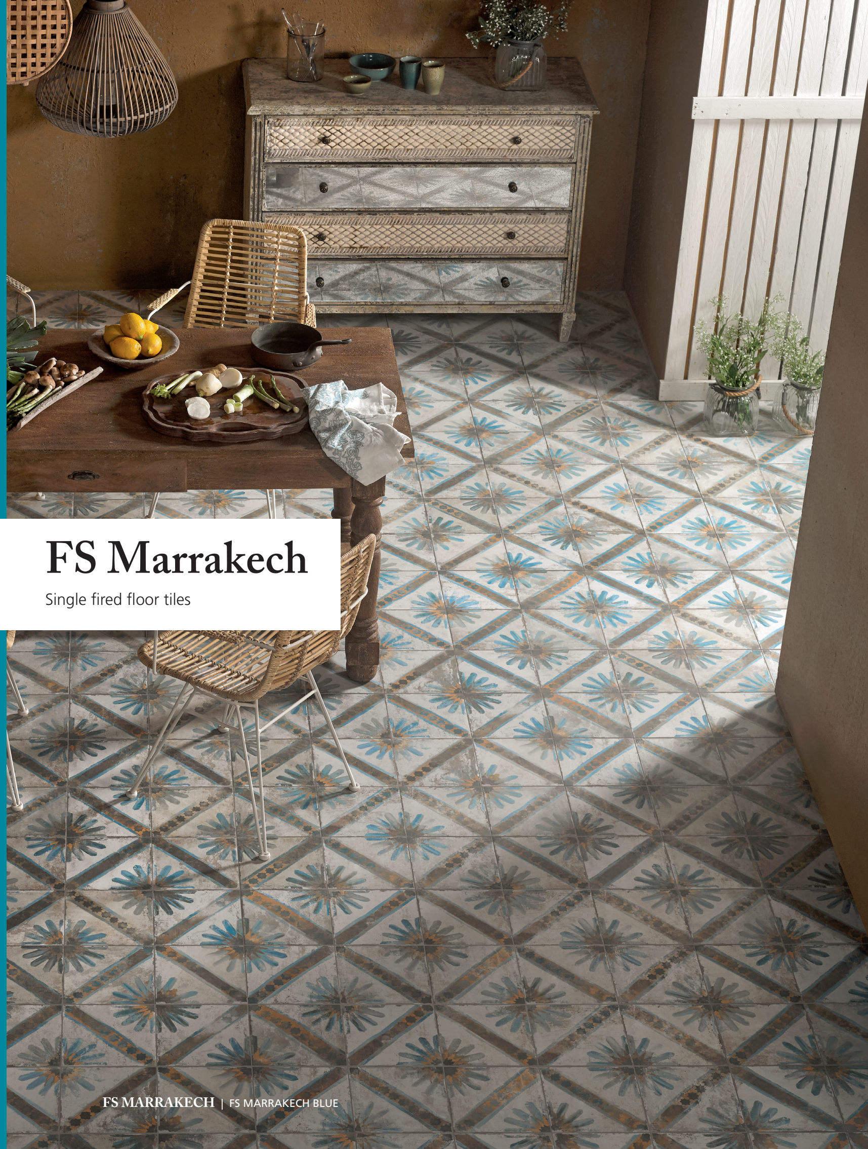
FS MARRAKECH | FS MARRAKECH BLUE