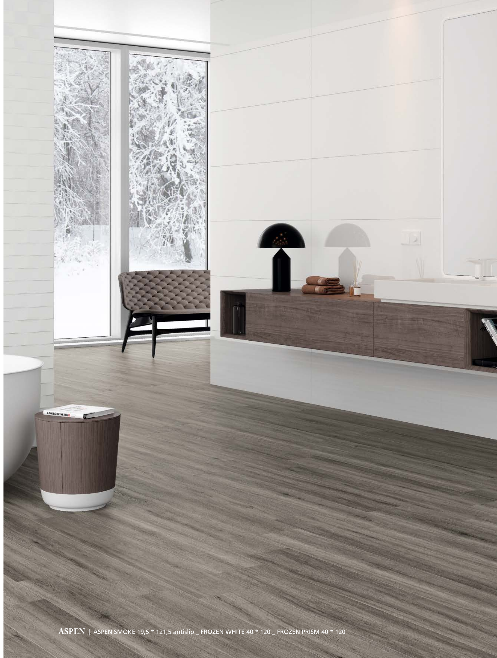
ASPEN | ASPEN SMOKE 19,5 * 121,5 antislip _ FROZEN WHITE 40 * 120 _ FROZEN PRISM 40 * 120