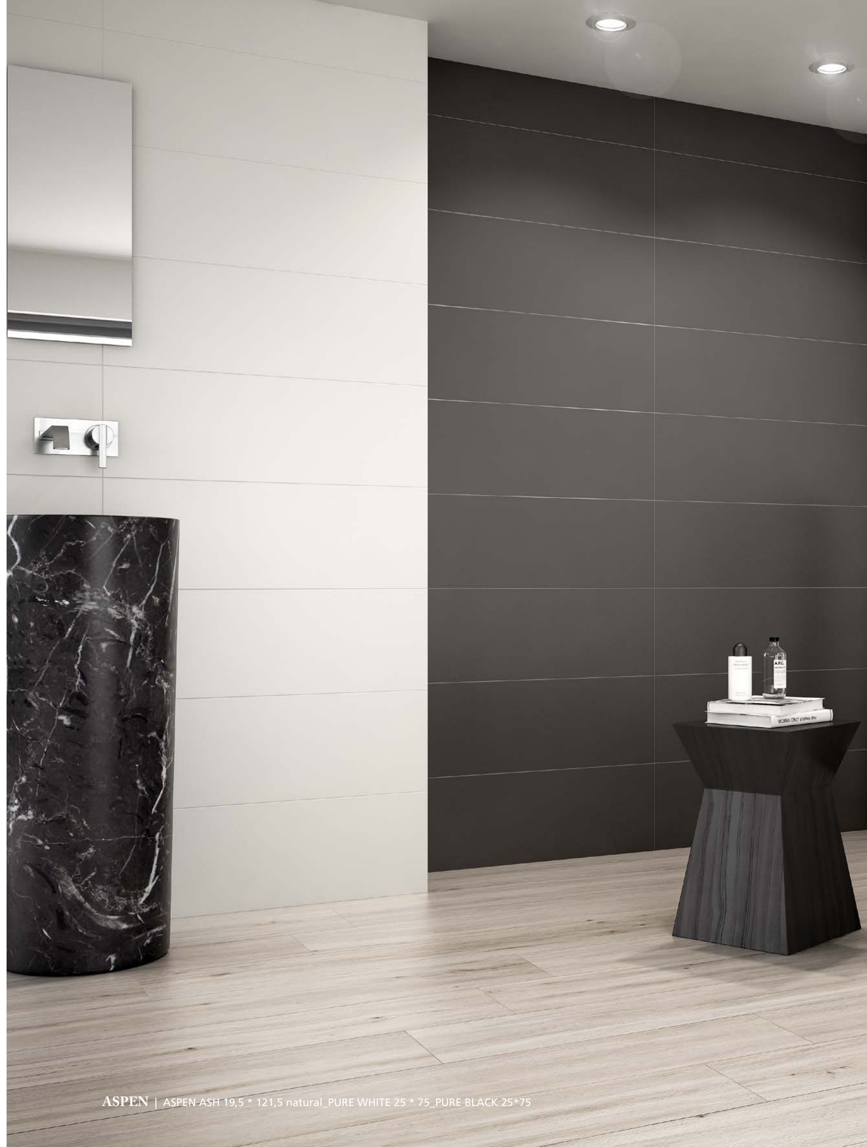
ASPEN | ASPEN-ASH 19,5 * 121,5 natural_PURE WHITE 25 * 75_PURE BLACK 25*75