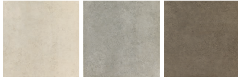
Нова Айвори Nova Ivory