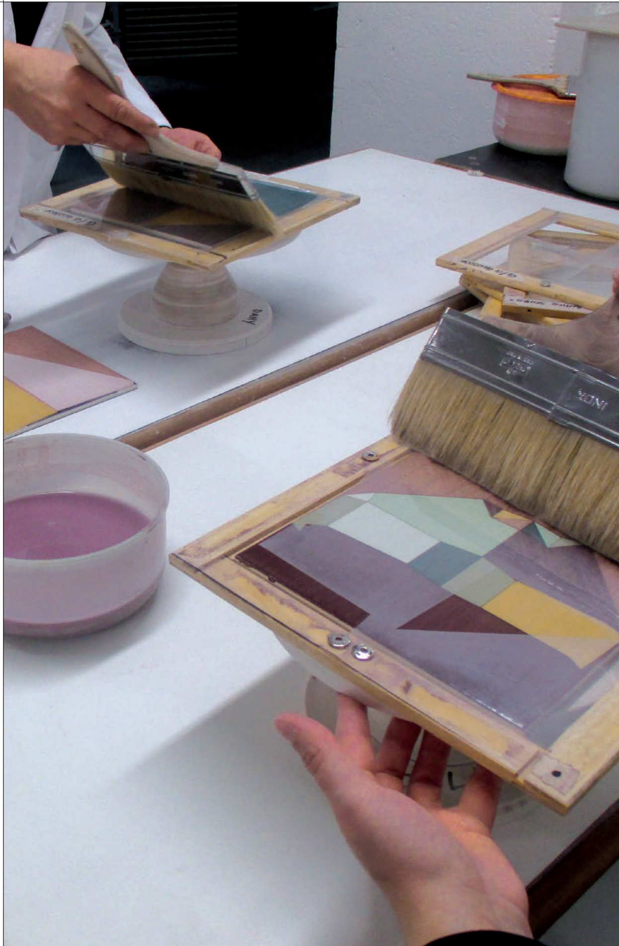
PENNELLATO A MANO / HAND PAINTED