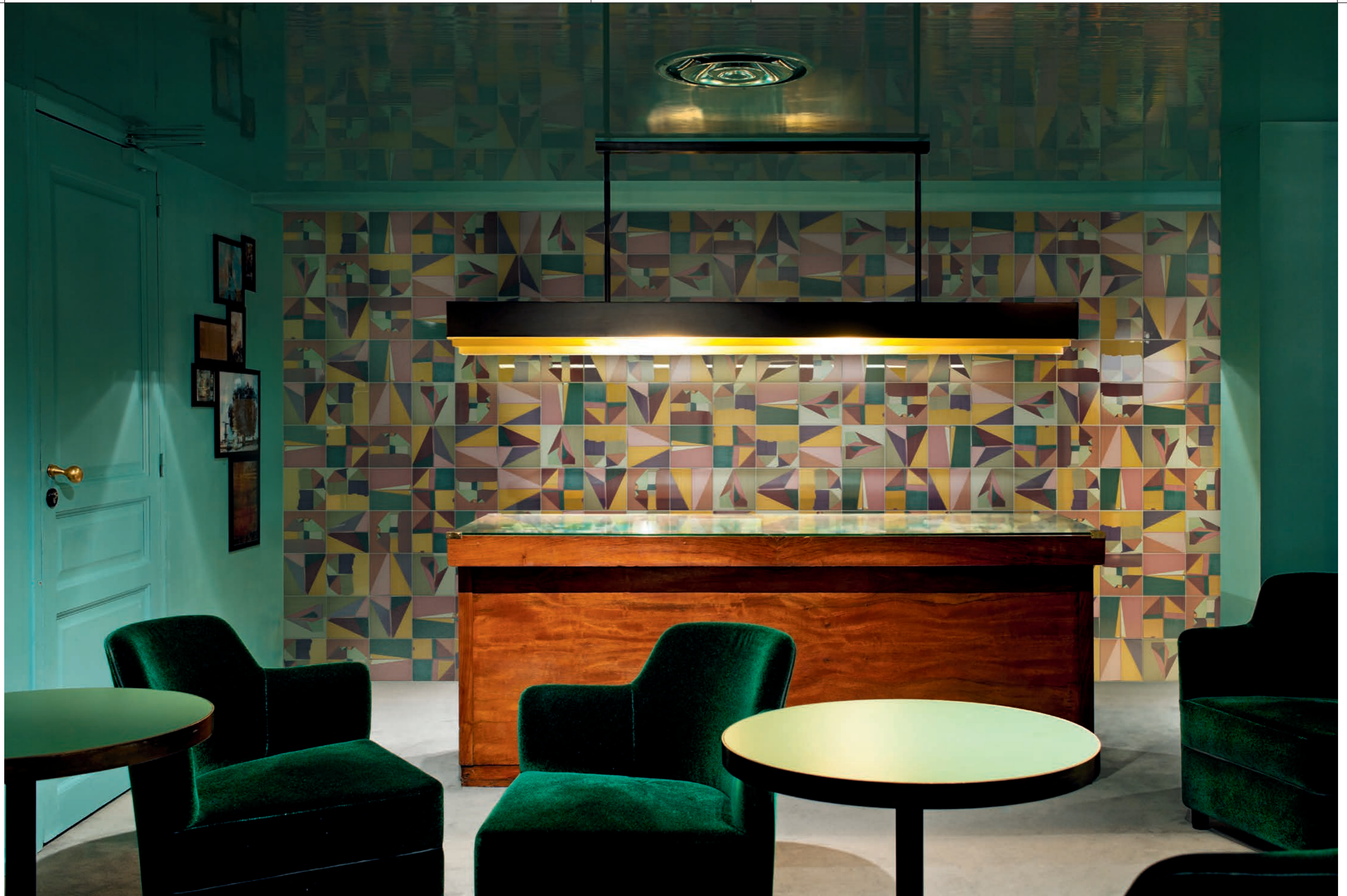
CONTRACT , Corrispondenza Rivestimento con posa a campo pieno / Covering all over layout