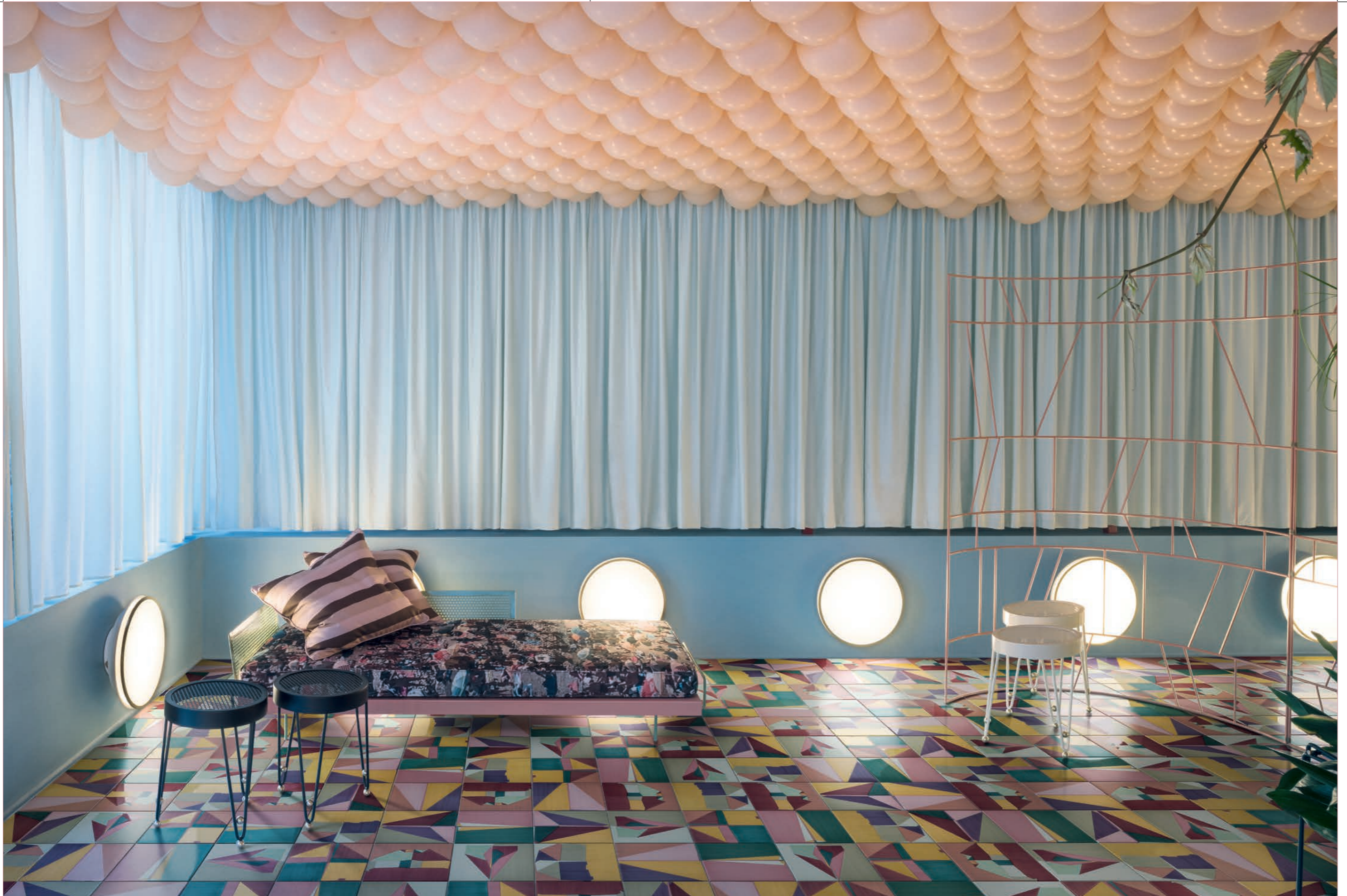
LIVING, Corrispondenza Pavimento posa a campo pieno / Flooring, all over layout