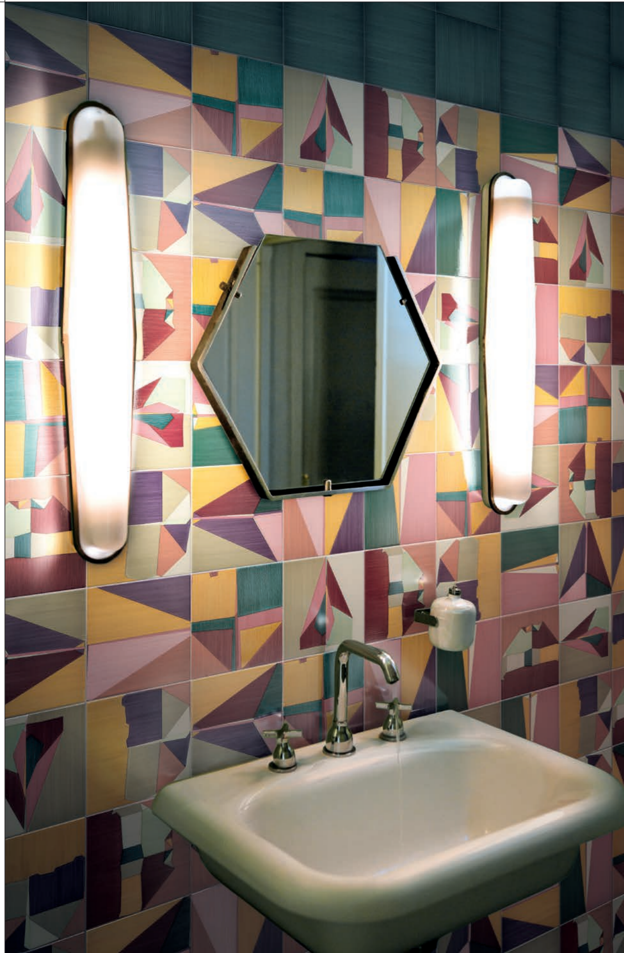
BAGNO/BATHROOM , Corrispondenza Rivestimento e pavimento in abbinamento con le tinte unite (CZ6) Covering and flooring, plain colours (CZ6) with decors