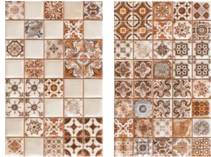
DECOR MIX (PREI)