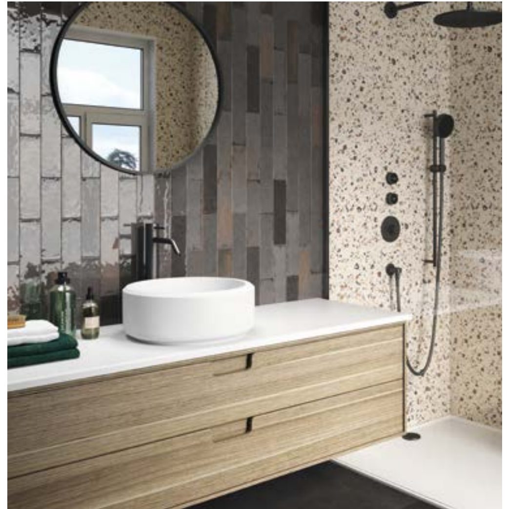
MURUS NOCTA 7X28.ARGILLAE NOCTA RECT. 60X60.COCCIO MIX RECT. 30X30