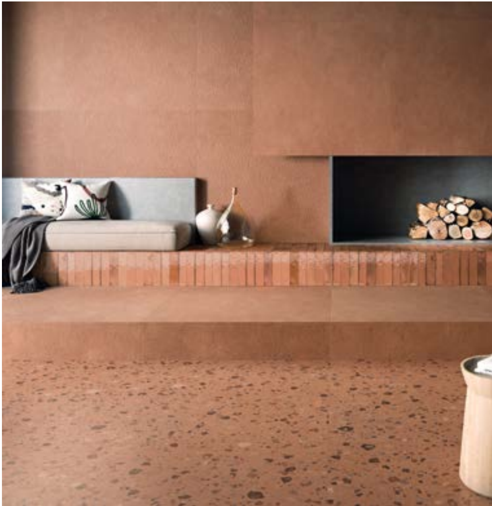
ARGILLAE TERRA RECT. 120X120. NISUS TERRA RECT. 120X120. COCCIO TERRA RECT. 120X120. MURUS TERRA 7X28