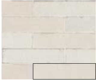
MURUS NIX 7X28 / 3"X11" J87/M