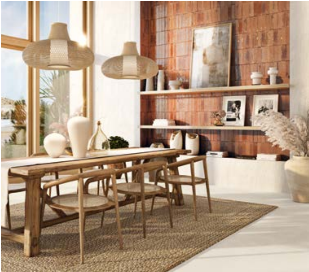
ARGILLAE NEVE RECT. 120X120.MURUS TERRA 7X28