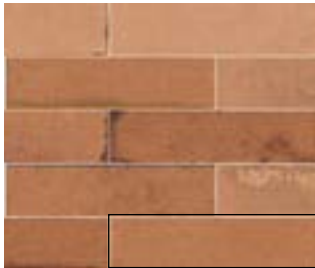
MURUS TERRA 7X28 / 3"X11" J87/M