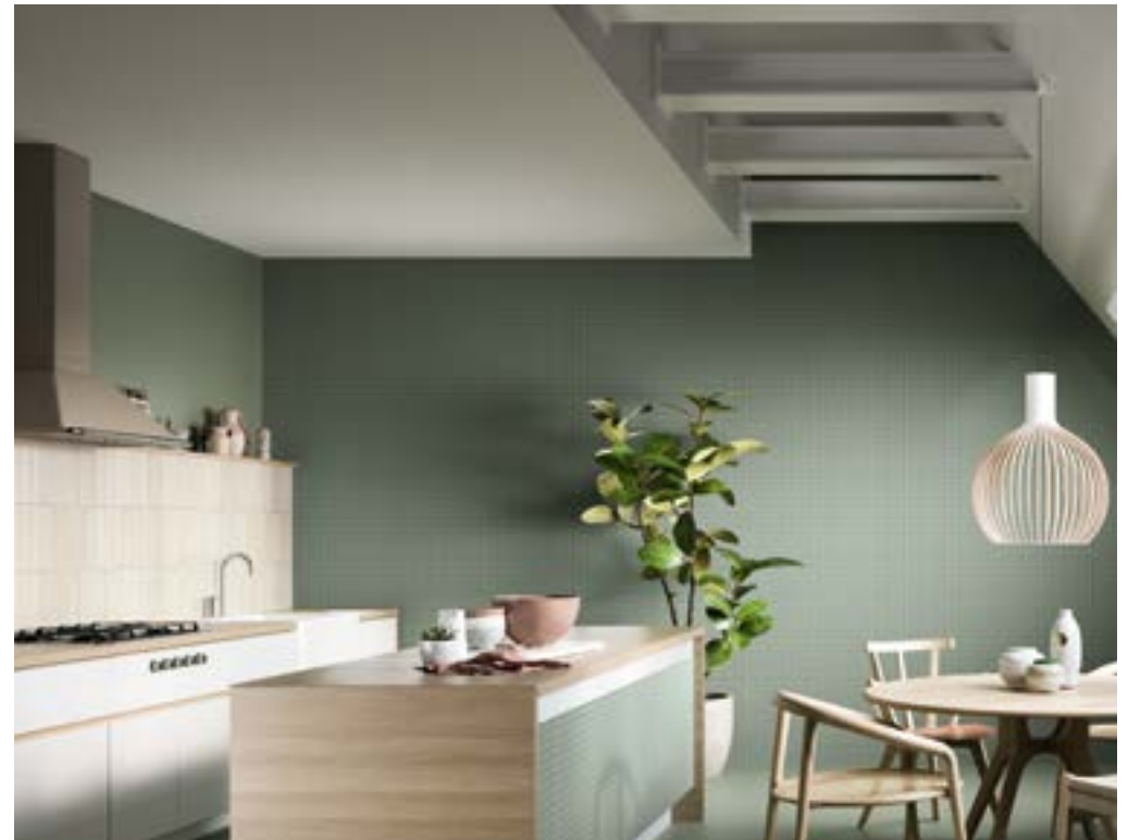
SAP MATT RECT 60X120.TAPESTRY SAP RECT 60X120.MURUS NIX 7X28