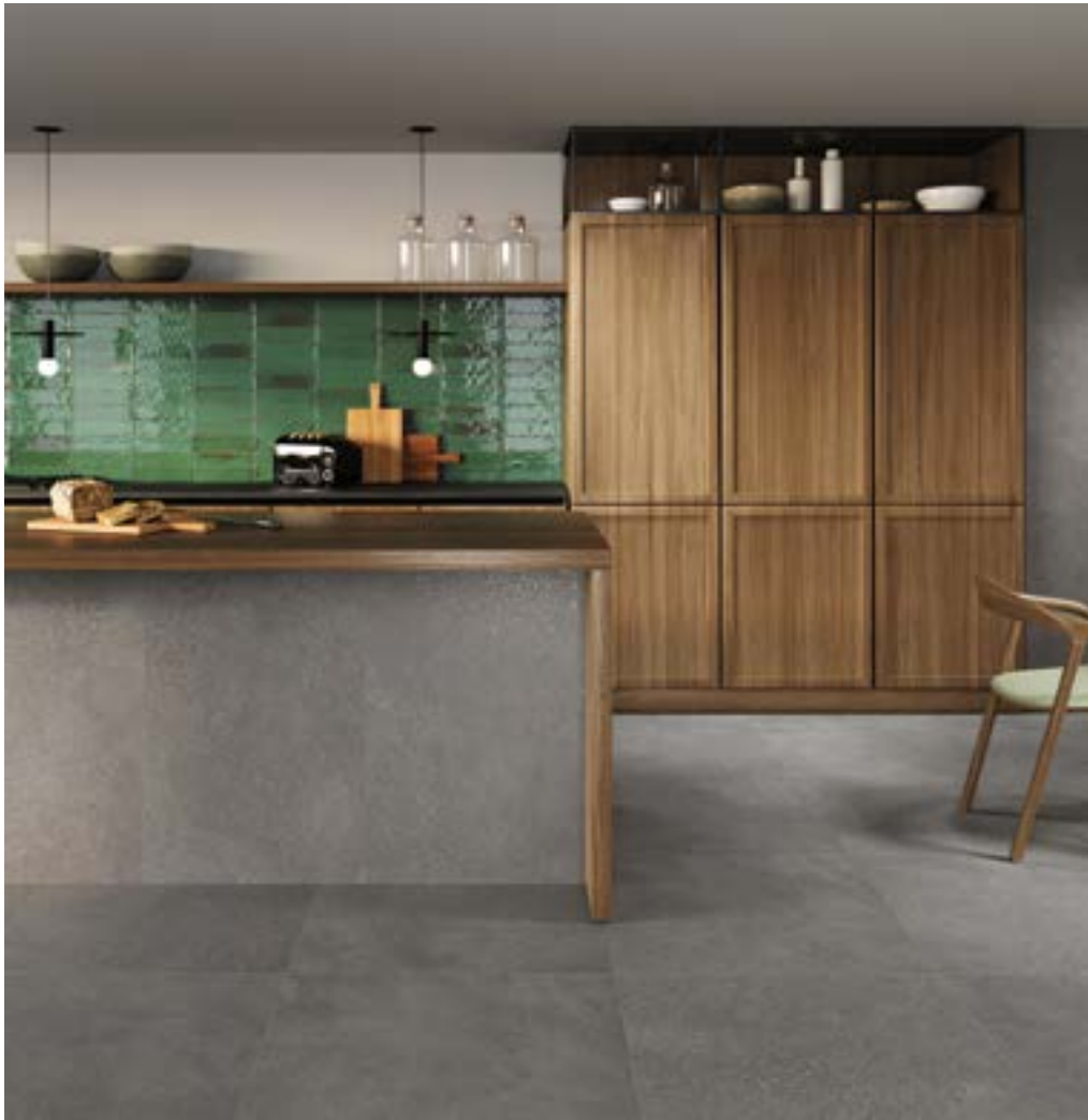
ILLINOIS GRAPHITE RECT 60X120.ILLINOIS GRAPHITE RECT 75X75.MURUS VIRIDI 7X28