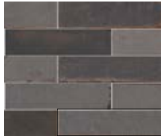
MURUS NOCTA 7X28 / 3"X11" J87/M