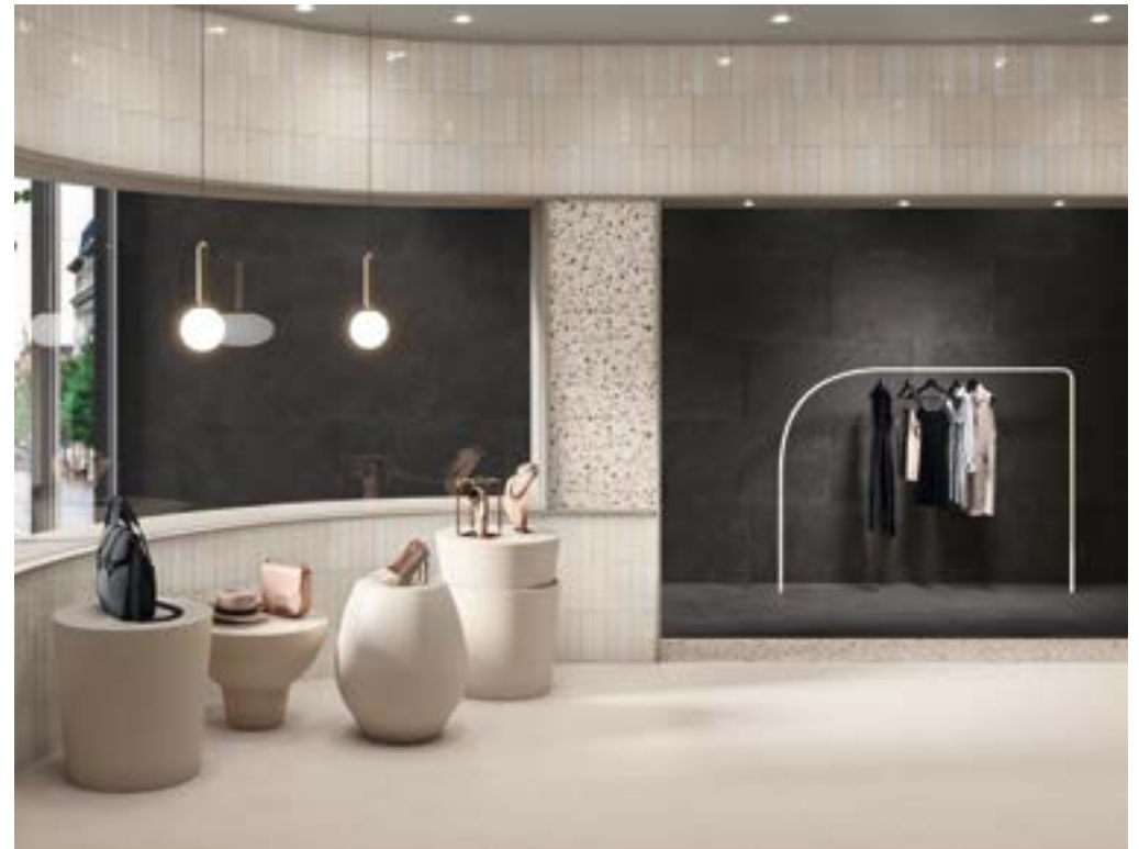
ARGILLAE NEVE RECT. 120X120. COCCIO MIX RECT. 30X30. ARGILLAE NOCTA RECT. 60X120. MURUS NIX 7X28