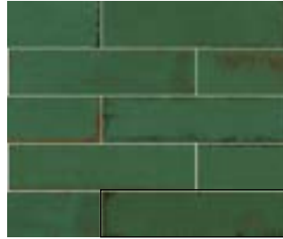
MURUS VIRIDI 7X28 / 3"X11" J87/M